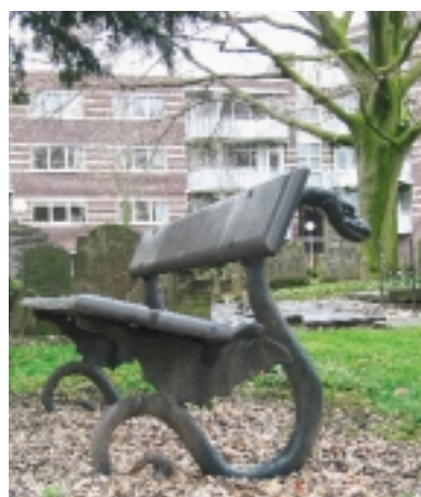
Deze bank op begraafplaats Ter Navoring in Tiel is fraai en passend bij zijn omgeving vormgegeven. Jammer genoeg is de directe omgeving van de begraafplaats nogal veranderd

beschermd, nog wel worden begraven en mogen er urnen worden bijgeplaatst?' Maar er zijn ook vragen van andere aard, zoals: 'Wat kunnen rechthebbenden verwachten als ze op een beschermde begraafplaats een oud graf weer in gebruik willen nemen?' Of: 'Wat moet een beheerder doen wanneer de in de redengevende omschrijving genoemde bomenlaan gebreken gaat vertonen of bepaalde grafmonumenten gevaarlijke tekenen van verval laten zien?' Door onbekendheid met het onderwerp en omdat een antwoord op deze vragen ontbrak, is in het verleden menige begraafplaats gesloten. Bij dit soort sluitingen speelde vaak ook de gedachte dat sluiting de instandhouding en bescherming van de begraafplaats ten goede zou komen. Het tegendeel blijkt veelal waar. Doordat een begraafplaats geen funeraire functie meer heeft, nemen beheer en onderhoud vaak af of wordt daar op den duur van afgezien, wordt de administratie verwaarloosd en raakt de begraafplaats gaandeweg in verval.